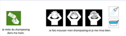
Pictogrammes de Pictosélector